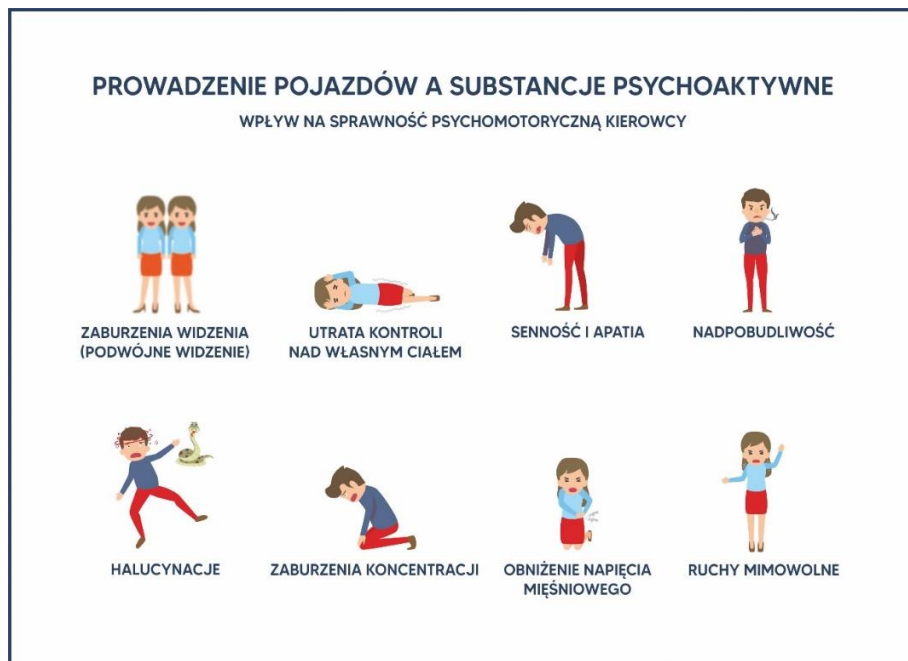
RYSUNEK 4: WPLYW SUBSTANCJI PSYCHOAKTYWNYCH NA SPRAWNOŚĆ PSYCHOMOTORYCZNĄ KIEROWCY